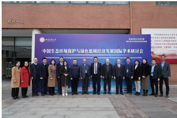
Групповая фотография Международного симпозиума по экологической защите окружающей среды и развитию зеленой и низкоуглеродной экономики