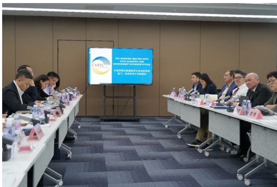
Институт ЦАРЭС укрепляет академическое и правительственное сотрудничество в принимающем городе

Заседание завершилось твердым обязательством Института ЦАРЭС углублять связи с академическими институтами и исследовательскими организациями по всему Синьцзяну. Содействуя такому сотрудничеству, Институт ЦАРЭС представляет себе будущее, в котором региональные партнерства будут стимулировать инновации, рост и процветание для всех стран-членов.