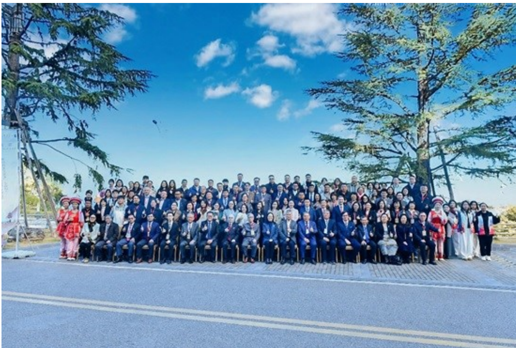
Групповая фотография форума Дали в Юньнани