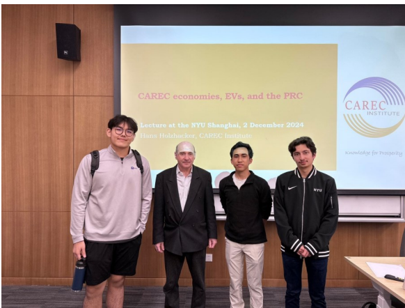
汉斯博士与参会代表合照

2024年11月27日至28日，SPECA经济论坛在塔吉克斯坦杜尚别召开，汇聚政策制定者、专家及相关方，共同探讨推动SPECA地区绿色经济转型的路径。论坛以聚焦对话与知识共享为核心，旨在加强区域合作，为可持续未来奠定基础。与会者特别强调向绿色经济转型的紧迫性，将可持续交通视为实现可持续发展目标和推动区域一体化的重要支柱。