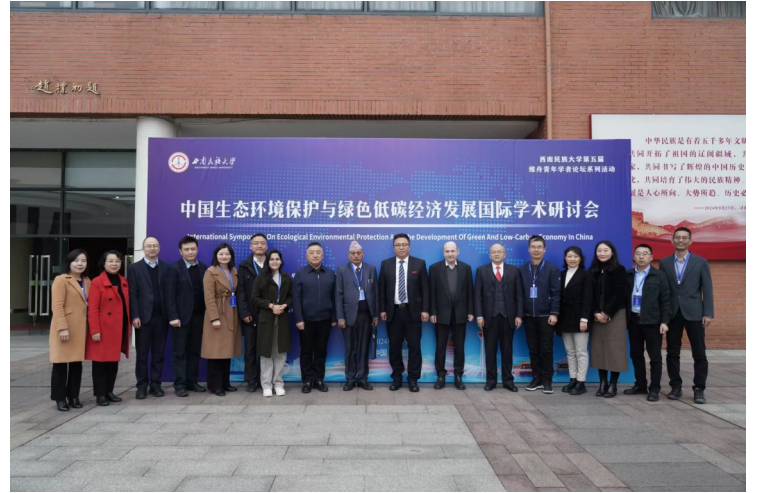
中国生态环境保护与绿色低碳经济发展国际会议参会代表合照

汉斯博士还谈到了几个CAREC成员国家单位GDP碳排放量过高的问题，敦促政策制定者优先考虑能源和农业等关键部门的可持续实践。通过促进合作和投资可持续解决方案，CAREC区域不仅可以减轻气候变化的不利影响，还能为更具韧性和繁荣的未来发展奠定基础。