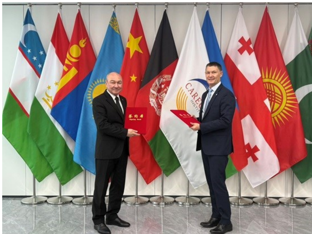
中亚学院与欧亚稳定与发展基金会签署战略合作备忘录

此次合作是双方发展历程中的重要里程碑，为进一步促进区域发展与稳定奠定了良好基础。