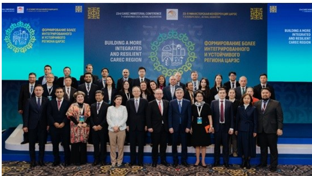
第二十三届中亚区域经济合作部长级会议合照

2024年部长级会议为各方重申承诺、设定战略优先事项、并深化CAREC重点领域合作伙伴关系提供了重要平台，为区域的可持续和一体化发展奠定了坚实基础。