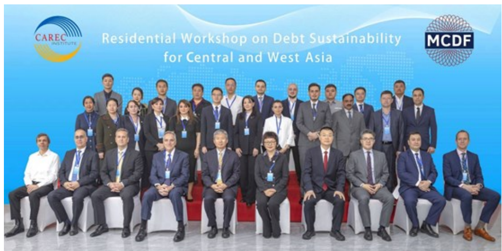
中西亚地区债务可持续研讨会合照

本次研讨会的议题包括债务管理策略、年度借款计划、负债与风险管理、债务可持续性分析以及债务重组等多个关键领域。在为期四天的活动中，公共债务管理领域的资深专家不仅进行了授课，并分享了应对主权债务问题的宝贵经验和实际案例。通过设置互动环节和促进同行间的学习，与会者进行了充分的交流。这种合作方式有助于各国制定切实可行的债务管理策略，还加强了借贷双方的合作关系，同时推广了最佳实践经验。此外，本次研讨会通过将债务管理与可持续发展目标相结合，为加强中西亚地区经济韧性和实现长期繁荣奠定了较好基础。