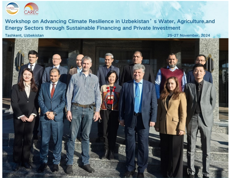
中亚学院举办加强气候韧性培训班参会代表合照

此次活动吸引了来自政府、国际组织及私营部门的多方代表，与会者共同致力于寻找务实解决方案，建立合作伙伴关系，推动投资与创新。培训班圆满落幕，各方一致表示将继续合作，应对乌兹别克斯坦的气候挑战，为该国的可持续发展贡献力量。