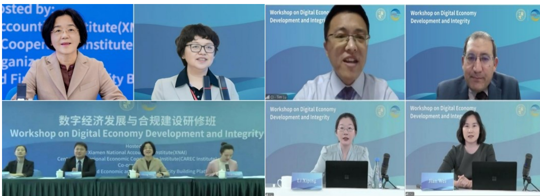
数字经济发展与诚信线上研讨会参会代表照片

中亚学院是CAREC机制的智力支持平台，聚焦经济和金融稳定，贸易、旅游和经济走廊，基础设施与经济互联互通，农业和水资源，和人文发展CAREC五大重点领域，促进区域经济合作和一体化。