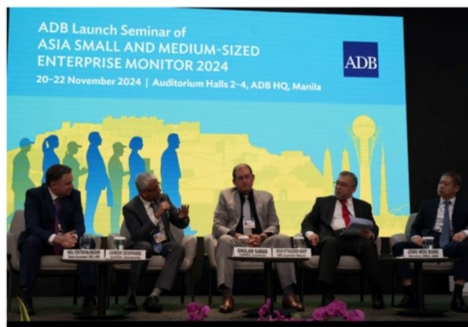
萨马德博士参与《2024年亚洲中小企业监测》报告发布会

萨马德博士表示，推动私有化和放松管制以促进经济多元化，是提升中小微企业对GDP贡献的关键。他强调，金融科技的应用是应对金融发展水平低下问题的重要途径；通过强化银行间合作关系和区域一体化，能够有效提升中小微企业的贸易融资能力。他还呼吁加大对数字基础设施的投资，包括互联网连接、支付系统、物流网络及监管协调，以帮助中小微企业在电子商务领域取得成功。