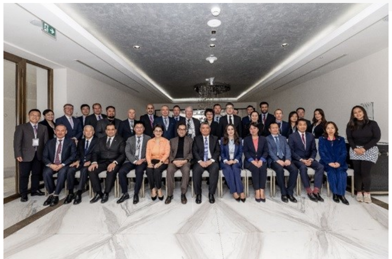
中亚学院第十五届理事会参会代表合照