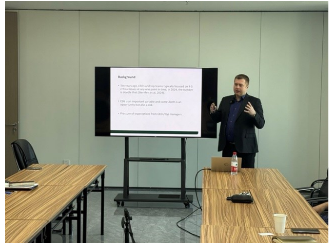
罗曼·瓦库尔丘克博士开展专题讲座

为应对这些挑战，罗曼博士提出应通过加强知识共享与能力建设，帮助企业有效识别和管理风险，同时抓住由ESG驱动的增长机会。他认为，这些举措将为中亚地区私营企业在绿色金融和可持续环境实践方面的转型提供切实可行的解决方案。