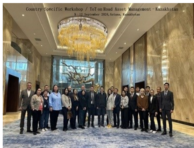
Групповые фотографии семинаров по управлению дорожными активами.