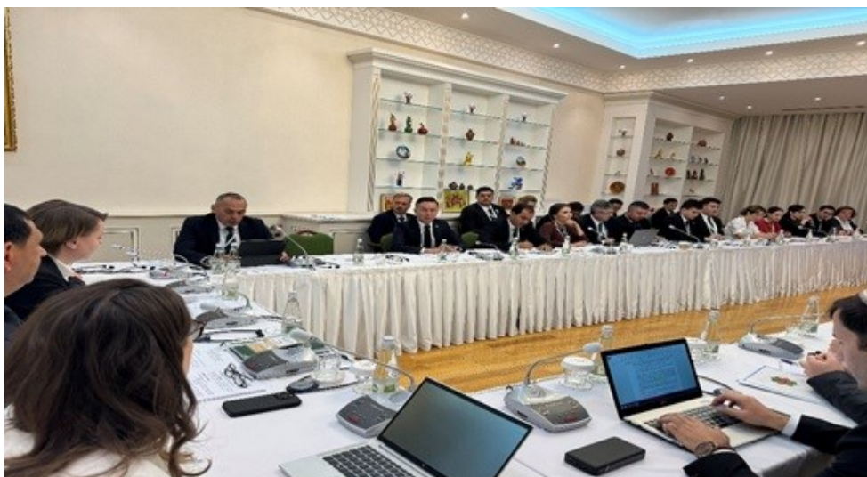
Г-н Кабир Джуразода выступил с речью на панельной сессии, посвящённой присоединению Туркменистана к Всемирной торговой организации

Панельная сессия стала одной из ключевых дискуссий на Инвестиционном форуме в Туркменистане, который охватил широкий спектр тем, направленных на стимулирование экономического развития страны и привлечение международных инвестиций. Форум предоставил важную платформу для обсуждения вопросов регионального сотрудничества, упрощения торговли и экономической интеграции, что подчеркивает роль Туркменистана в мировой экономике.