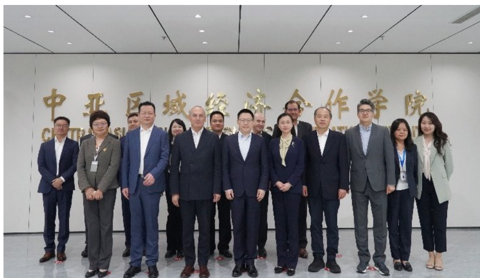
Групповое фото в штаб-квартире Института ЦАРЭС