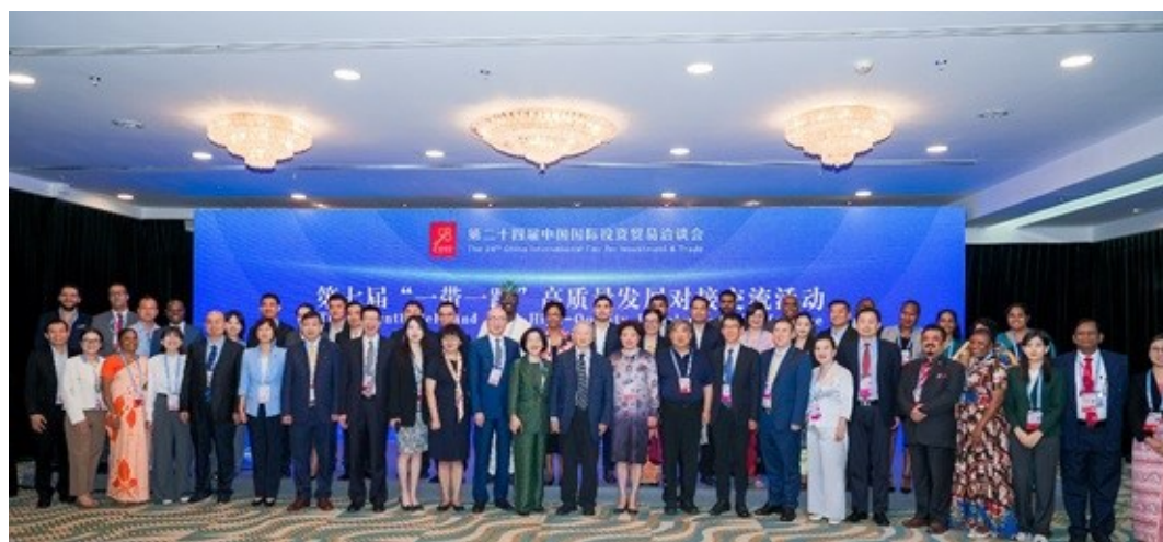
Групповое фото 7-й конференции по высококачественному развитию инициативы «Пояс и путь» в Сямэне

Участие Института ЦАРЭС в этой конференции подчеркивает его приверженность содействию региональному сотрудничеству, продвижению инноваций и поддержке стран-участниц в условиях быстро меняющегося мирового экономического ландшафта.