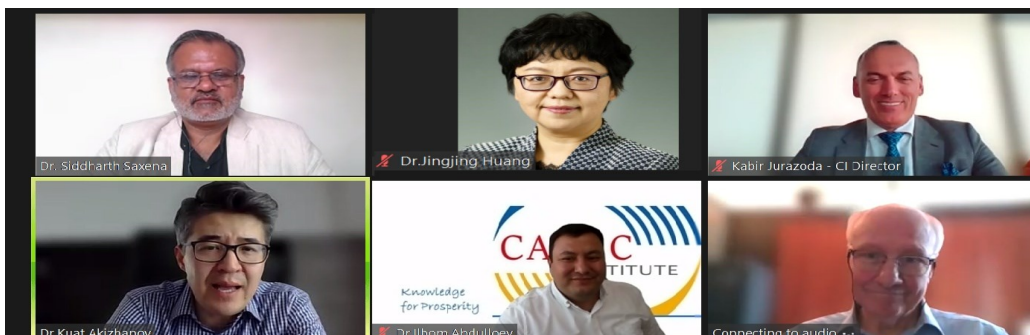
Групповое фото десятого ЦАРЭС Чай

Смотря в будущее, будущие исследования в регионе ЦАРЭС должны сосредоточиться на сложных взаимосвязях между неравенством доходов и богатства и его влиянием на социально-экономическое развитие. Это включает изучение влияния глобализации на создание рабочих мест и экономическую интеграцию, а также роль цифровых и зеленых переходов в создании возможностей для достойной работы. Необходимы инновационные инструменты измерения для точной оценки неравенства и его социально-экономических последствий. Исследования также должны учитывать исторический контекст экономических различий в регионе, исследуя, как прошлые экономические системы продолжают влиять на современные неравенства. Междисциплинарные исследования, которые интегрируют экономические, социальные и экологические перспективы, будут ключевыми для разработки комплексных стратегий по преодолению этих вызовов и содействию инклюзивному росту.