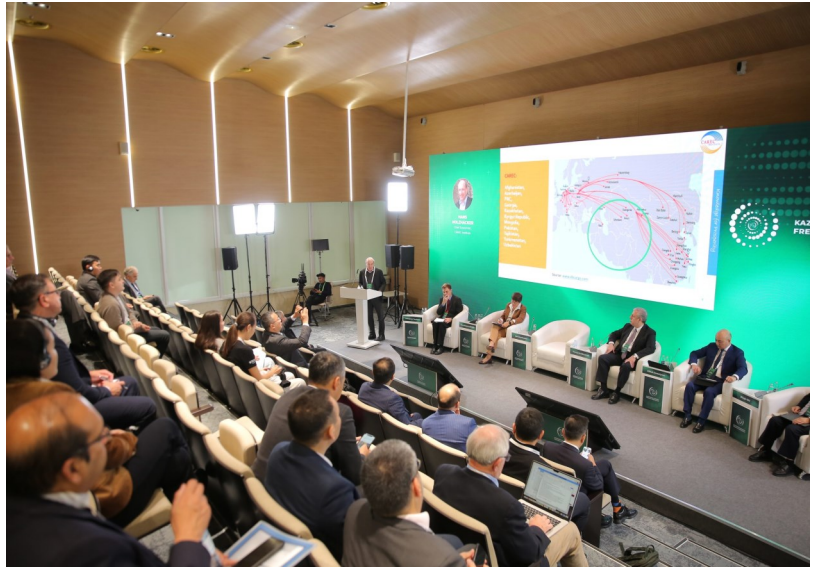
汉斯·霍尔扎克博士在第一届哈萨克斯坦经济自由高级别会议上发言

会议还强调了可持续性和技术在未来经济政策中的重要性，讨论了金融技术和区域可持续发展努力。与会者对加强国际合作和建立有韧性的经济框架表示乐观，认为这是哈萨克斯坦在全球经济中发挥更重要作用的基础。