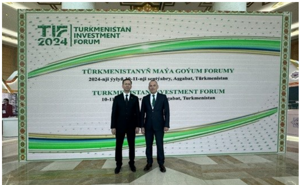
卡比尔·朱拉佐达院长在土库曼斯坦投资论坛上会见土库曼斯坦国别联络人

会议最后，双方再次确认将共同致力于推进CAREC地区发展目标，并加强在研究、能力建设和区域互联互通方面的合作。