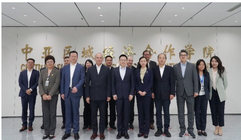
中国财政部副部长廖岷一行访问中亚学院合影

此次访问在双方重申加强长期合作与战略对接的承诺中圆满结束。双方一致同意，将继续推动学院成为区域知识交流的枢纽，并共同努力，为区域经济合作和全球可持续发展做出更大贡献。