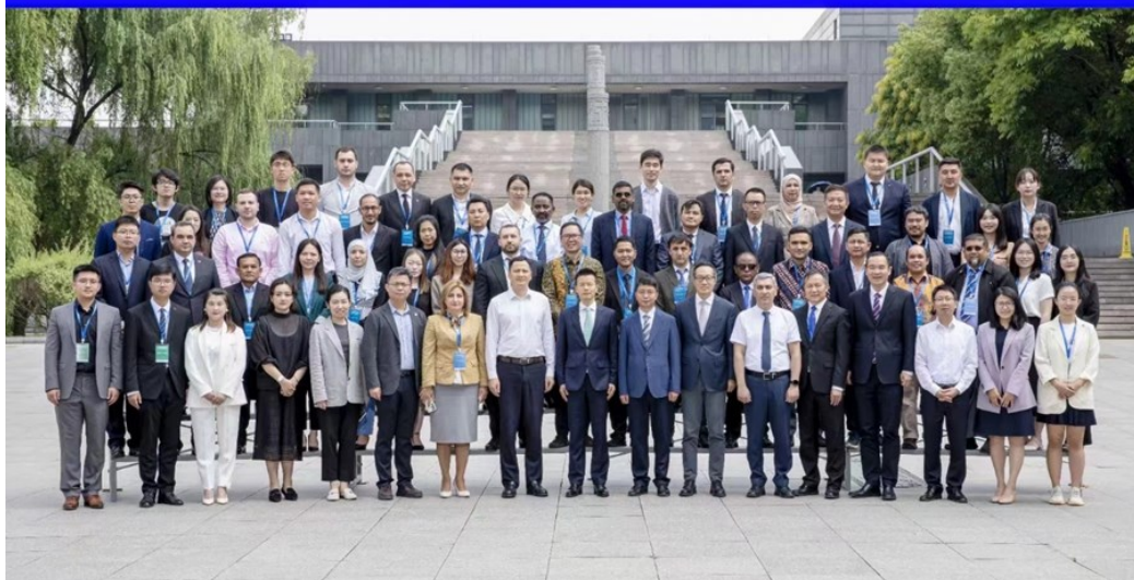
第二届中国-东盟数字经济研修班暨首届中国-中亚区域经济合作数字经济研修班参会代表合照