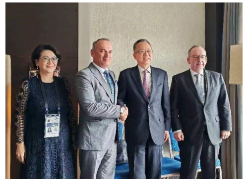
中亚学院代表一行与亚行副行长杨英明先生进行会晤

此外，学院代表收到了针对学院知识产品的正向反馈，并受到鼓励学院继续开展旗舰活动、发布年度报告以提高知名度和影响力。学院也听取了通过透明和择优的程序征聘高素质员工的建议，以进一步提升学院业务水平。