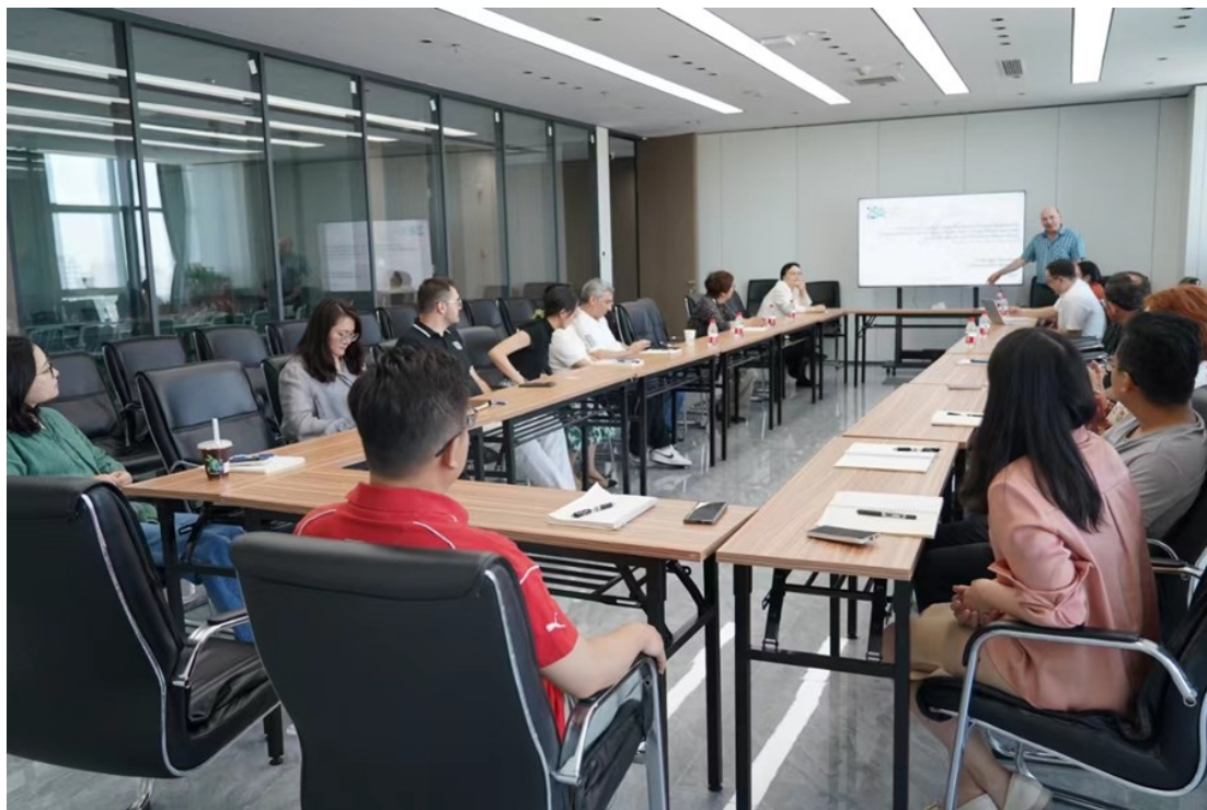
哈萨克斯坦社会民意研究所来访中亚学院

会上，学院强调了其一贯以来基于实证和研究的工作理念，致力于促进CAREC成员国家内部和成员国之间的知情决策，并引发关于社会经济发展战略的深入讨论。