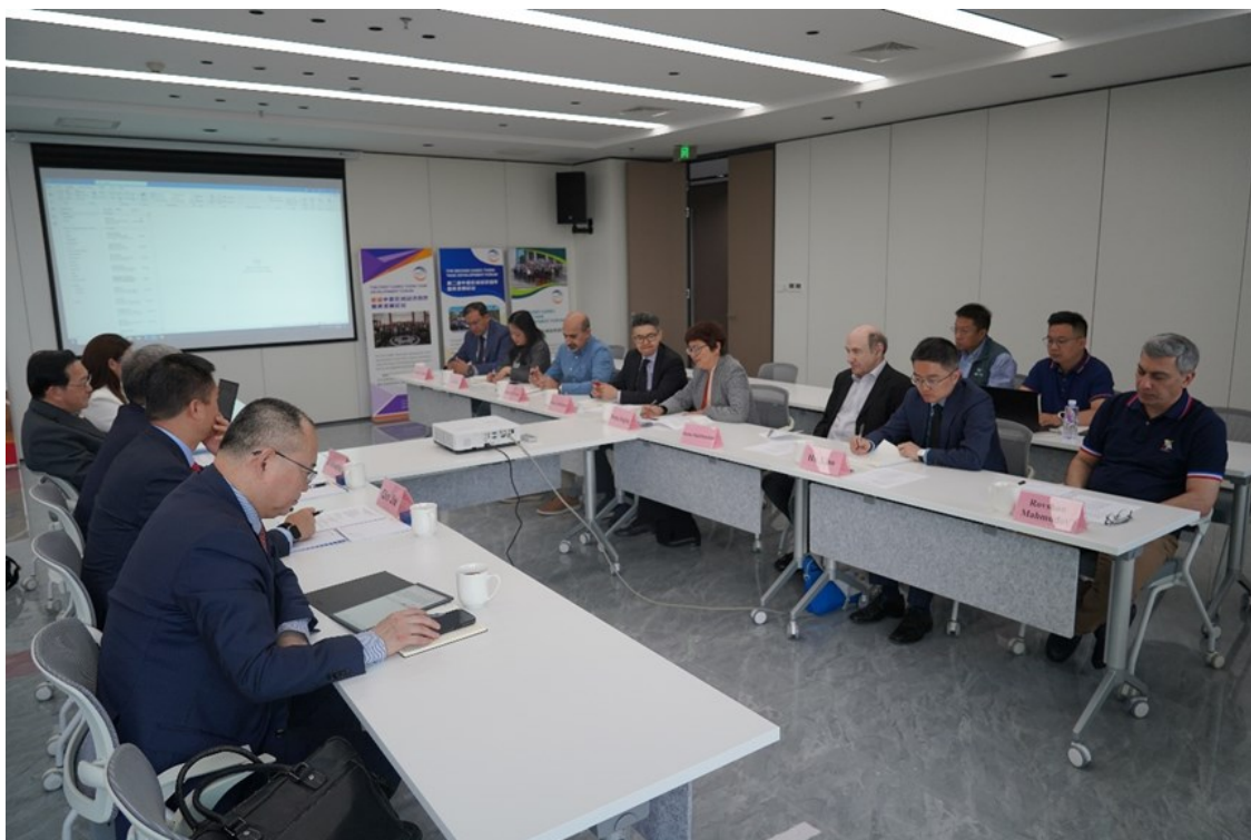
东盟与中日韩宏观经济研究办公室代表一行来访中亚学院

AMRO与中亚学院加强伙伴关系将有助于提升东盟与中日韩以及CAREC地区经济韧性和稳定。双方的合作将对所有成员国发展大有裨益，将促进持续的经济增长和发展。