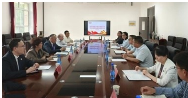
中亚学院拜访新疆大学交流合作意向

新疆大学经济与管理学院成立于2001年，是新疆地区经济与管理领域人才培养和学术研究的重要枢纽。