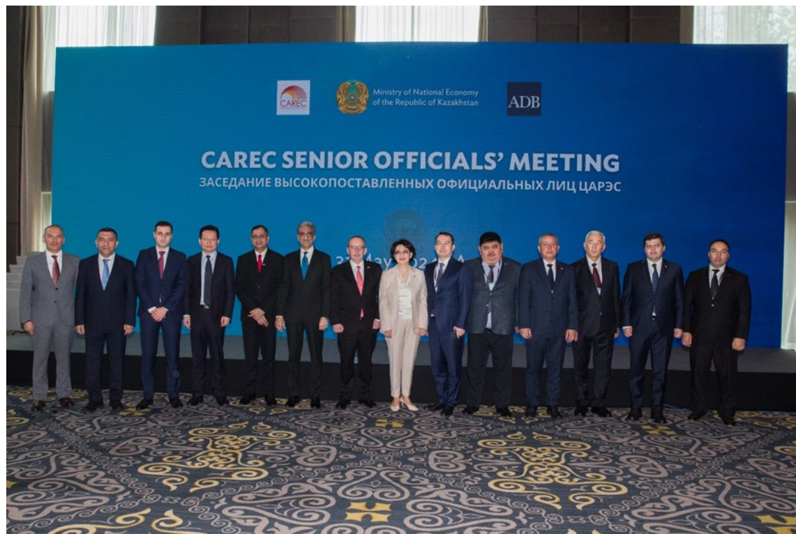
中亚区域经济合作高官会议参会代表合照