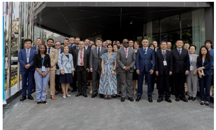
WASH论坛参会代表合照

此次论坛为促进区域合作、加强对话和发展伙伴关系提供了一个重要平台，旨在应对CAREC地区在供水和环境卫生领域面临的挑战。